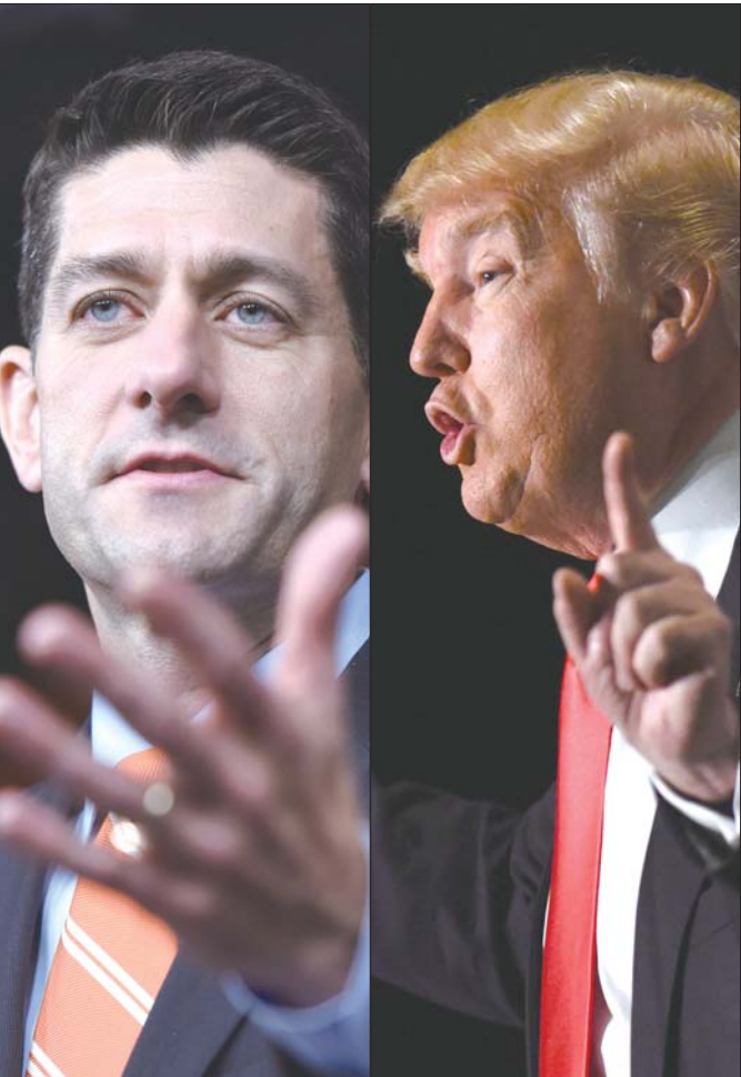
2日,美国众议院议长、共和党人保罗·瑞安(左)宣布,他将在今年11月的美国大选中投票给该党总统选举“假定提名人”特朗普。(资料片)