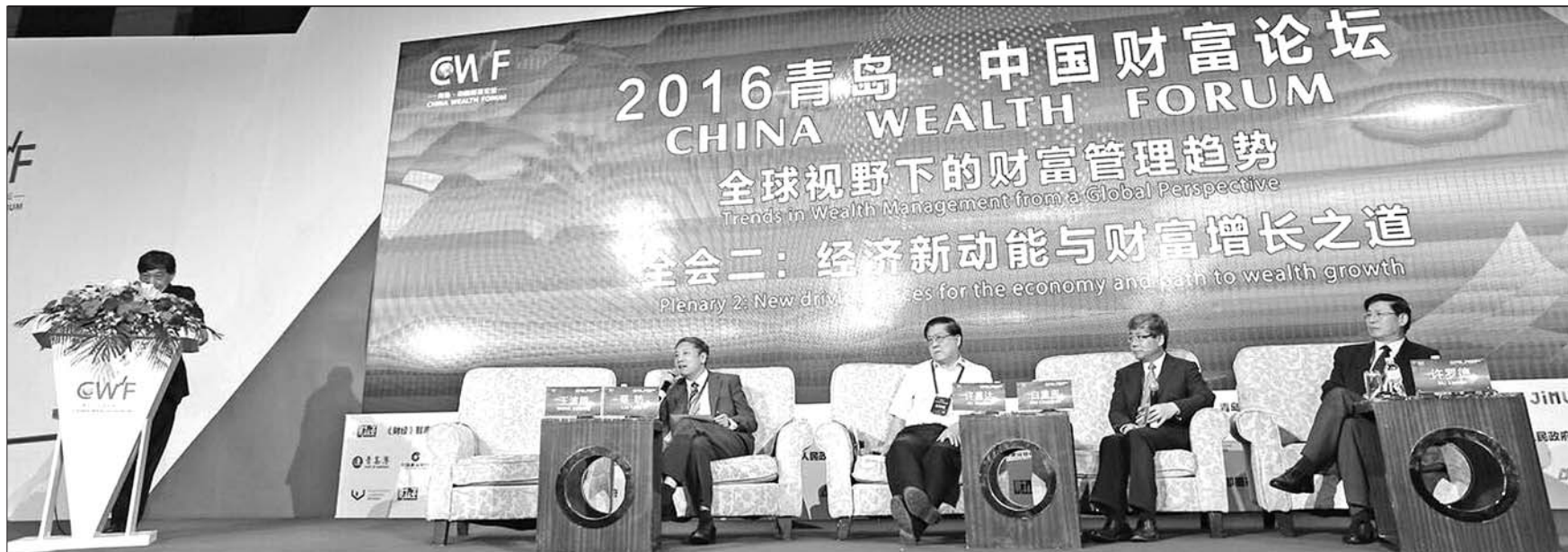
4日,2016青岛·中国财富论坛在青岛开幕。