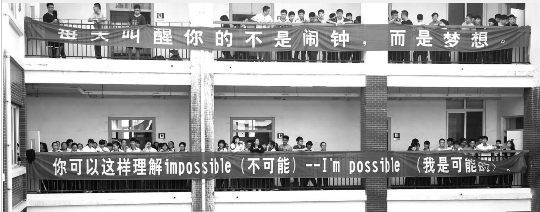
悬挂在教学楼上的大幅励志标语激励着孩子们的每一天。