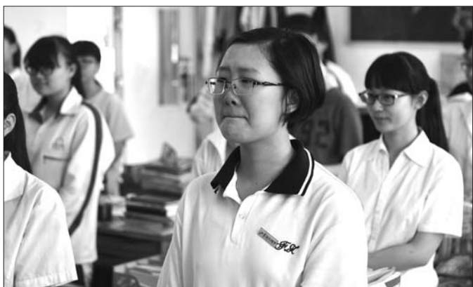
高三17班最后一次全体唱歌，一位女生泣不成声。

6月4日，山东师大附中幸福柳校区，29个高三毕业班的1439名学生，度过了他们高中学习生涯的最后一天。