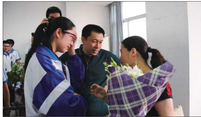
高考结束后,考生和家长把鲜花送到老师手中。