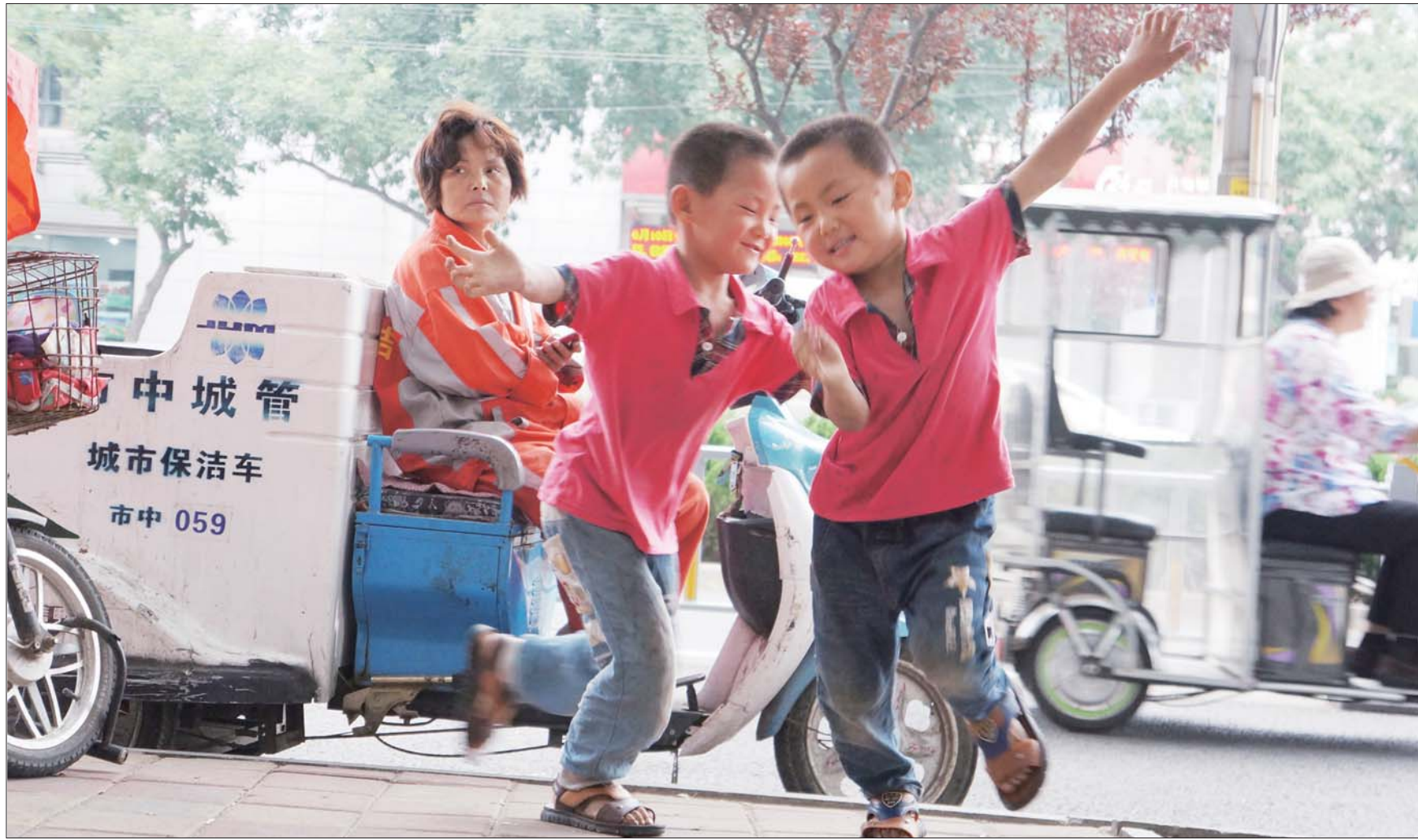
小哥俩跟妈妈上街扫马路，妈妈休息的时候他俩就在旁边嬉戏打闹。