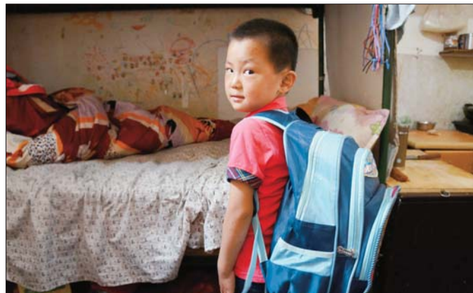
虽然暂时进不了学校，但是小嘉兴背上书包就不愿拿下来了。