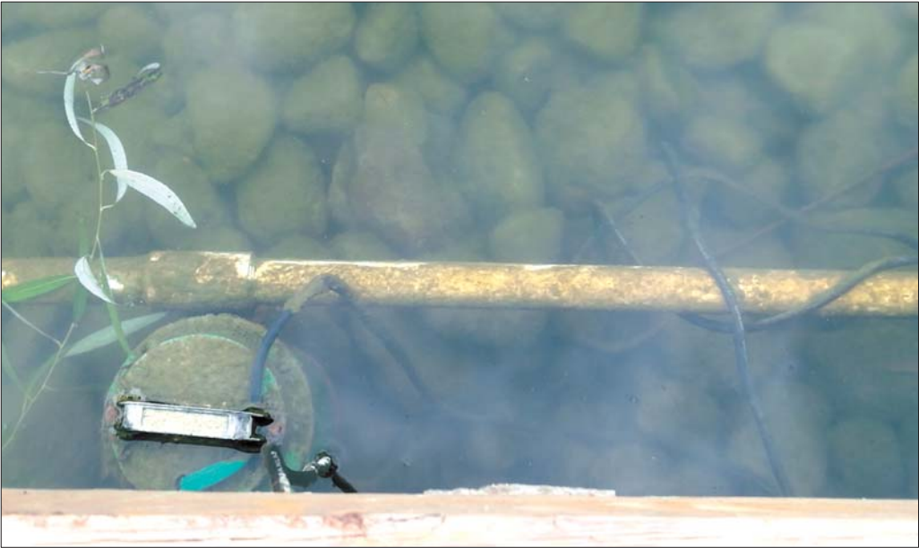
家长怀疑是水池内水泵及其线路漏电，造成悲剧发生。

视频显示，11日中午12点28分，小军和一名胖男孩进入水池内玩耍，当时，水池内的喷头一直在喷水。12点37分，胖男孩开始向上拉扯喷头，喷头所连接的电线一度露出水面。之后，胖男孩将喷头对准小军喷水。小军本想远离，不过忽然身子一扭，脸朝下趴在水中，这名男孩也扑腾了一下，然后立刻返回岸边。而此时，监控中已经