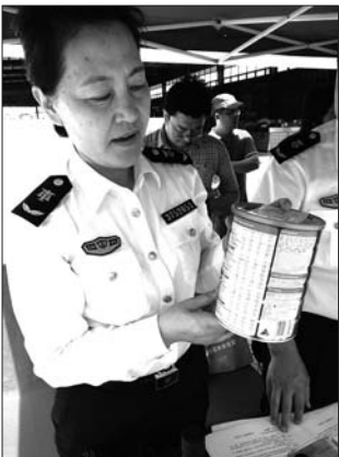
工作人员现场演示如何鉴别奶粉。

“一般通过正规渠道进入中国的进口商品，都会有详细的中文标识。如果没有中文标识，除亲戚朋友从国