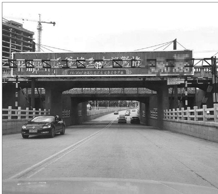
火炬路公铁立交积水排得快。