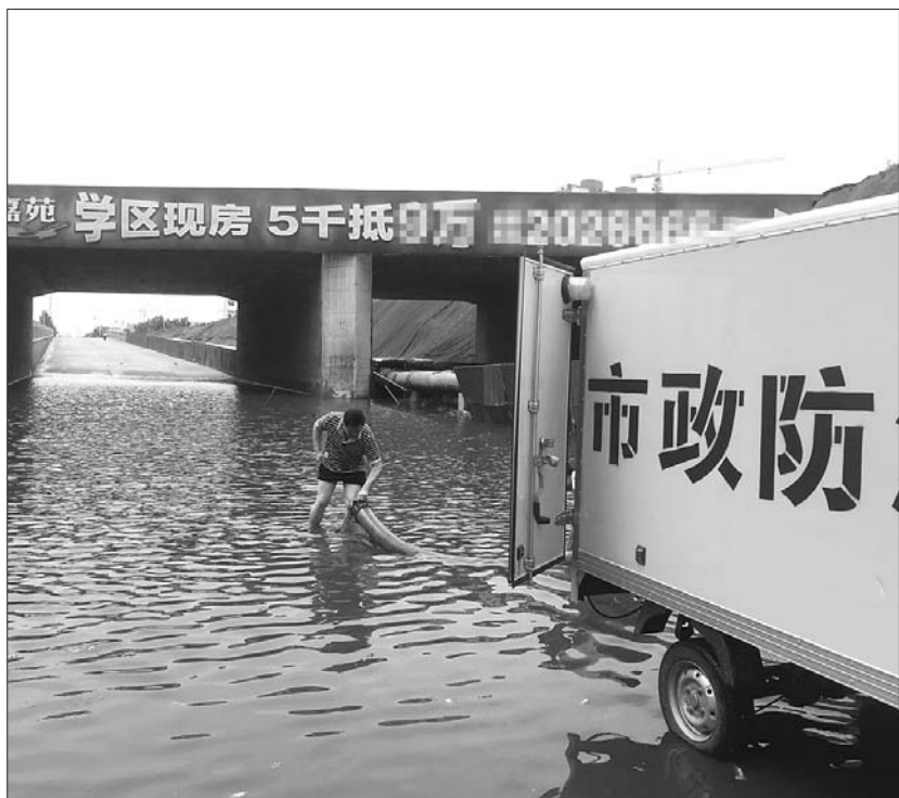
济安桥南路公铁立交积水严重。