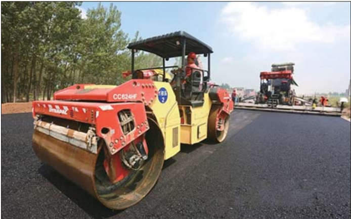
聊阳路升级改造。(资料图)