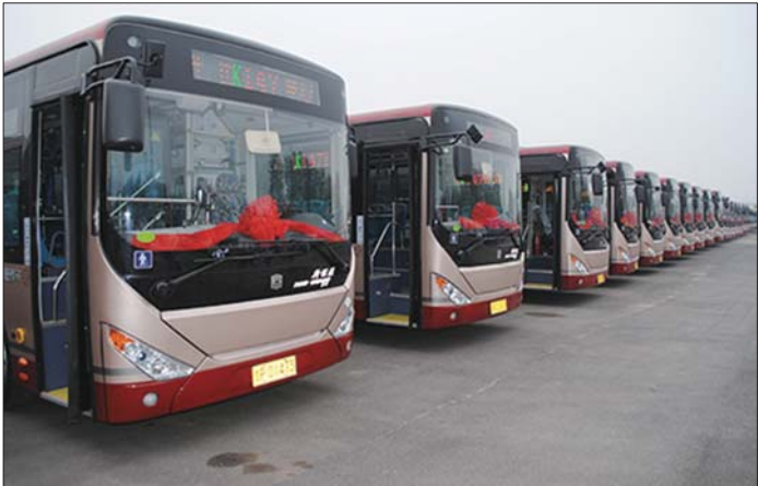
聊城新能源公交。(资料片)

今年,中心城区计划新增新能源公交车220辆,新增充电终端160个,新建改造候车站点亭70组。着手建设城市公共自行车出行系统。