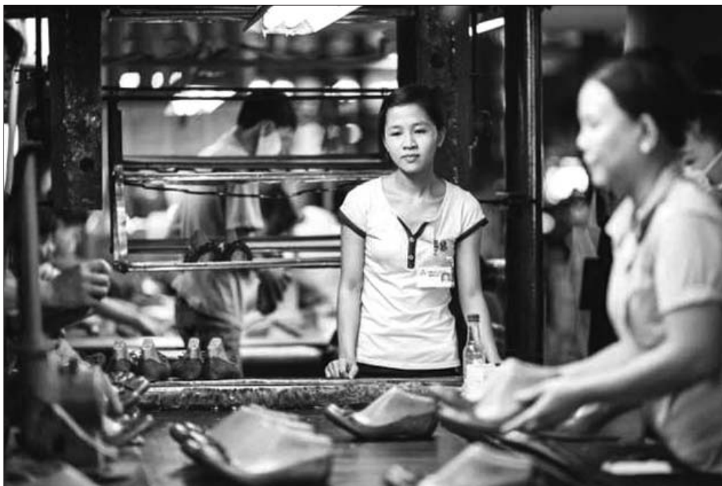
在越南的市场上，买家与卖家很多都是女性。

来越多外国人的越南姑娘们看到了外国男性的优势，这也许才是与外国人相亲的网站那么火的原因。