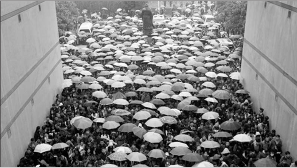
图为考生排队进入公务员考场,目前,公务员仍是最吃香的职业。(资料片)