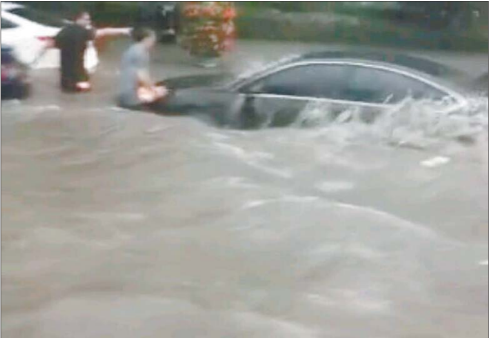
21日下午，济南飞跃大道济钢桥下水流很大，多辆汽车遭水淹抛锚。