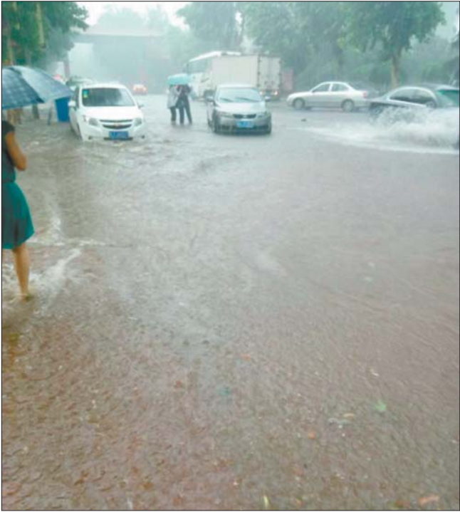
21日下午，济钢新村附近路面有积水。

21日下午4点到晚间10点，短时强降雨从东到西先后侵袭济南，部分路段积水严重，交通陷入瘫痪，给市民出行造成很大困难，对济南的道路泄洪系统再次提出了考验。