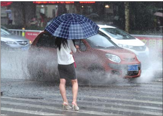
23日，历山路上一些车辆飞速行驶，让行人来不及躲避，时常溅一身水。