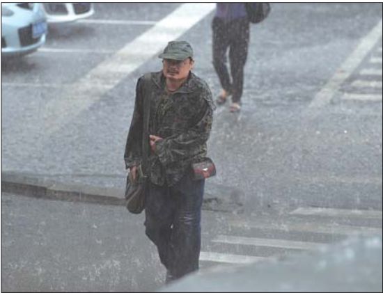
23日，一场急雨突袭济南，很多行人猝不及防，有点狼狈。