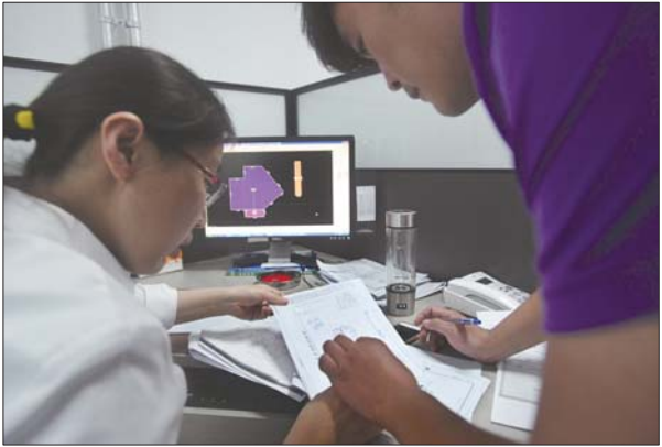
▲测量完的数据要交给其他工作人员，绘出平面图。