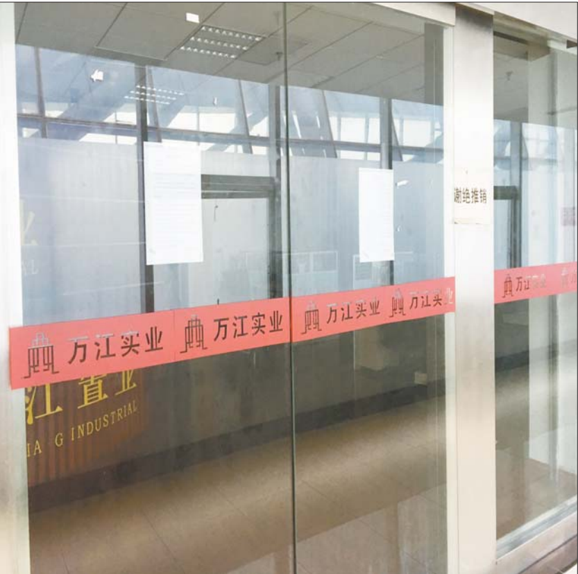
万江置业有限公司大门紧锁。

本报6月30日C20版报道了冻文路人防商城延期,业户违约金和本金难以追回的情况。30日,该人防商城的开发商山东万江置业有限公司办公室关门,并贴出告知书,称项目无法继续,责任在济南市人防开发服务中心。冻文路人防商城工程面临“烂尾”,到底是谁的责任?没有合法建设手续的人防商城项目为何能一路绿灯,甚至向公众招租?