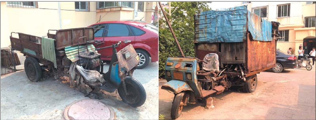
4区7号楼1单元外停放着两辆“僵尸三轮车”。

“我们这儿是回迁安置小区,拿4区7号楼来说,居民原先都是附近孙庄和小良村的村民,平时靠种地为生。2006年集体搬入小区后,以前种地用的三轮