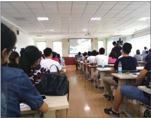
志愿者接受培训,7月1日正式上岗。

明单位的240名志愿者参与执勤,每天执勤时间为7点至9点和17点至19点,共4个小时。 高新交警大队王玉忠介绍,随着城区多条道路集中施工,市区很多路段压力骤增,特别是早晚高峰期拥堵严重,“通过开展文明交通志愿服务活动,一方面可以带动参与活动的文明单位和志愿者自身遵守交通秩序,同时影响身边的一批人,营造良好的交通环境。” 据了解,为了保障交通文明志愿者开展好服务,各文明单位将做好后勤工作,对于社会招募的志愿者将由市、区财政给予必要补贴,并为志愿者购买人身保险。