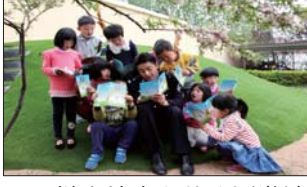
悦庄镇中心幼儿园邀请镇派出所民警进校园讲解安全知识。(马淑英)