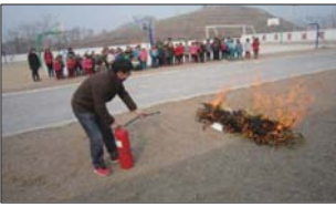
沂源县菜园希望小学为学生安全保驾护航。