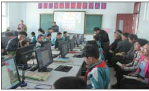
近日,悦庄教体办举行打造高效课堂现场会。(张仁春)