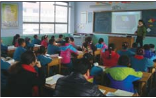
沂源县悦庄镇埠村希望小学开展“人人一节好课”活动。(江艳)