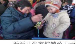
沂源县张家坡镇致力于建立新型家园关系。(李光禄 王晓霞)