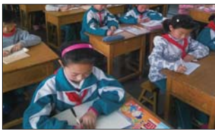
沂源县悦庄镇埠村希望小学对学生进行读写姿势的强化训练。(任会美 崔君玉)