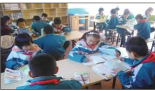
沂源县张家坡镇教研室发起读书活动。(李光禄)