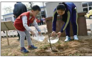
沂源县菜园小学师生共同栽种友谊树,见证师生情。