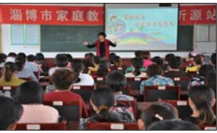
近日,沂源县悦庄镇中心小学举行了家校沟通开放日活动。