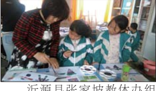
沂源县张家坡镇教体办组织教师到各教学分部开展送教活动。(李光禄 逯良银)