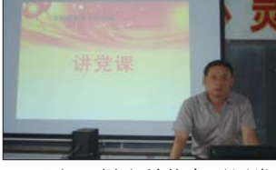
近日,悦庄教体办开展党风廉政建设活动。(张仁春)