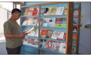
近日,沂源四中发动学校全体教职工捐助图书。(翟乃文)