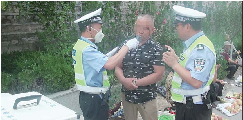
民警对“奥迪男”进行酒精呼气检测。

本报7月5日讯(记者 张泰来) 为了躲避处罚,一名驾驶红色奥迪轿车的中年男子也是拼了.在距离交警检查点大约100米处停车,撒腿就往反方向跑,结果不慎跌进路旁的深沟,面部、脚部都受了伤,被随后赶到的民警控制.逃跑中,奥迪男的鞋子都跑丢了,狼狈地站在交警面前,却还不肯老实配合检查,连吹了四五次才成功,测试值达到97mg/100ml,涉嫌醉酒驾驶。