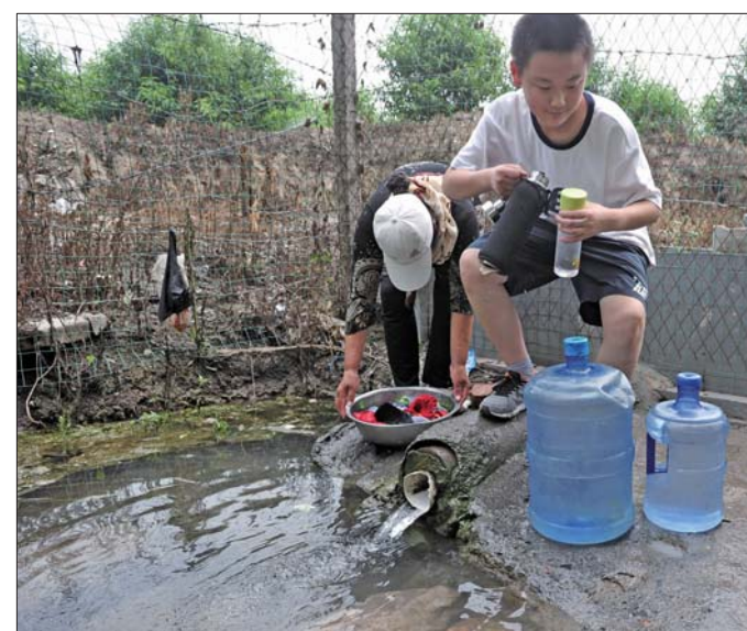
6日,王舍人镇附近的白泉边,附近村民乐滋滋地来取水。

根据规划,白泉湿地公园建设项目位于历城区东北部王舍人片区,北至距济青高速公路350-600米一带,南至纸坊村北一带,西至南滩头村一带,东至东梁王庄三村。建成后不仅将挽救濒临停喷的白泉泉群,还将为济南市增加一处特征最明显、离城区最近的湿地公园。