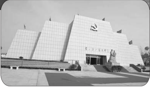
►鲁西第一党支部旧址陈列馆(资料片)。