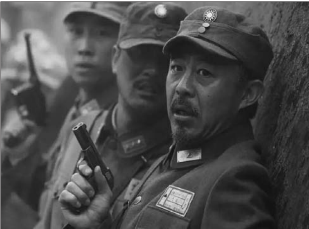
电视剧主演侯勇剧照。

民族危难时刻的国共兄弟情、日军的疯狂侵略、特务间谍的暗杀和破坏、抗日民族统一战线的跌宕起伏、誓死鏖战的故事。 聊城是革命老区,此前没有一部在全国有影响力的影视作品。电视剧《铁血将军》的全国热映填补了聊城无重大影视作品的空白。而该剧在国内多个电视台播出,剧中涉及的大量聊城元素,势必成为聊城文化和旅游资源的一个良好宣传载体。该剧将大大激发聊城人民热爱家乡的豪迈情怀,促进聊城文化旅游事业的发展和对外传播力的提升。