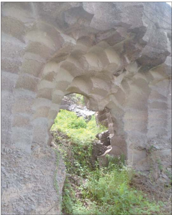
开山凿石制作石磨留下的“石磨坑”。