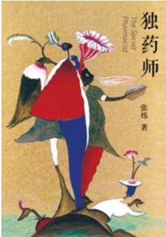
《独药师》 张炜 著 人民文学出版社出版

张炜不可能意识不到这种风险的存在。一定是有些什么催促或逼迫着他，让他坚持按照自己的意愿完成了这部作品。为了强化故事的可信性，他