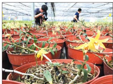
▲斗门逸丰千亩仿野生铁皮石斛开花了。