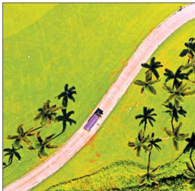
▲航拍海陵岛十里银滩椰树、草坪。