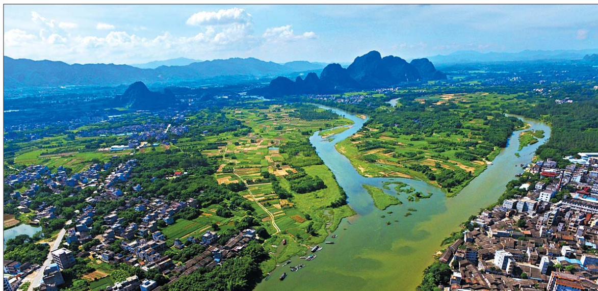
▲航拍阳江阳春秀美山水,这里属于中国大陆最南端的喀斯特地貌地带。