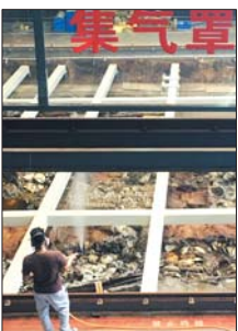
▶“南海一号”博物馆内,工作人员对文物进行喷水保护作业。