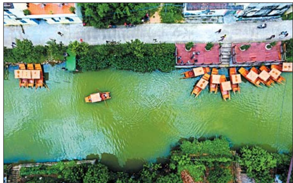
▲航拍珠海斗门,白云淡淡地映在水中。