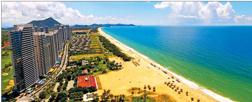
▲航拍壮丽的海陵岛十里银滩。