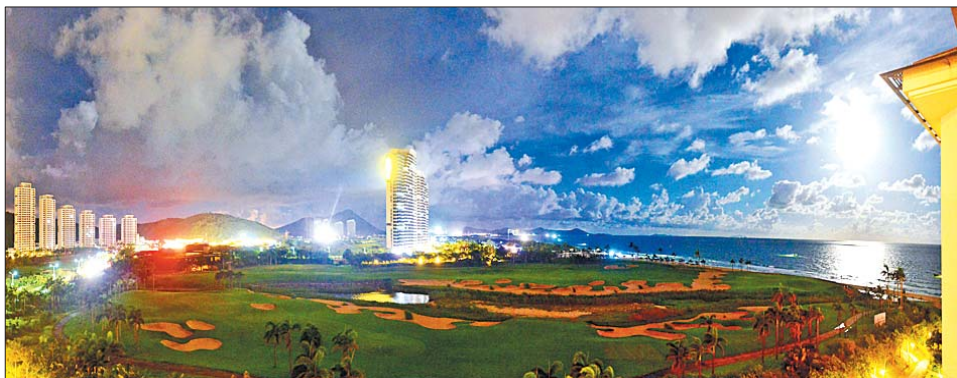
▲晚上10点,海陵岛十里银滩灯光、月光映出的蓝夜。