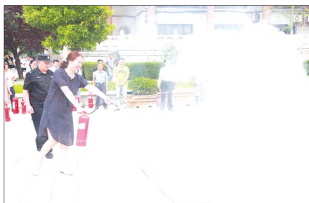
8日,济宁市文物局、市公安消防支队在济宁博物馆举行文物消防安全培训。消防支队监督执法人员结合多媒体课件讲授了文物古建筑防火知识。60余名参训人员在消防官兵指导下,进行了消防操作技能演练。