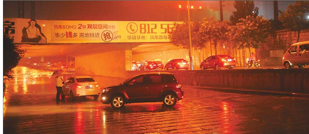
12日22:30, 奥体中路北段立交桥主交通干线仍然无法通行, 许多车辆绕道副道通过。

根据济南气象部门的预报, 济南12日(夜间)有雷阵雨, 按照过去的认识, 这雨很可能挺小, 甚至有可能不下。有这种想法的济南市区的市民晚上出门可吃亏了, 雨不仅下了, 还下得很急, 很多地方几小时就达到了暴雨级别。