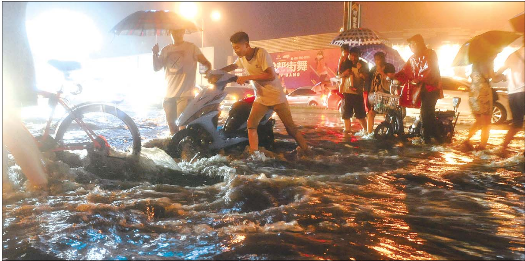
12日22:00, 济南二环东花园路路口, 积水超过30厘米。