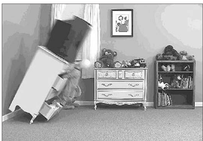
抽屉砸死儿童事故模拟。视频截图