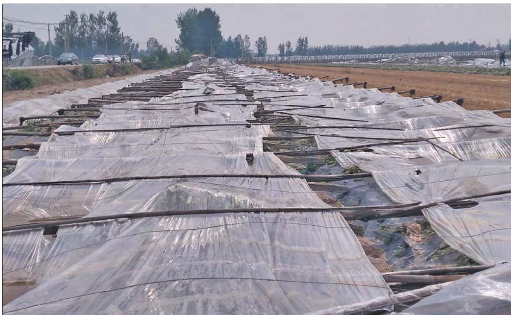
6月13日,济阳县太平镇来佛寺村遭遇大风冰雹,低温棚被刮得散了架(上图)。瓜农秦清安看着被冰雹砸裂的西瓜,心里很不是滋味(左图)。

7月本应是西瓜价格正便宜的时候,但今年的瓜价一反常态,进入7月后一路上扬。虽然价格比去年翻番,市民们吃西瓜贵了,但济南周边相当一部分瓜农却没挣到钱,甚至有不少瓜农连本钱都没收回来。