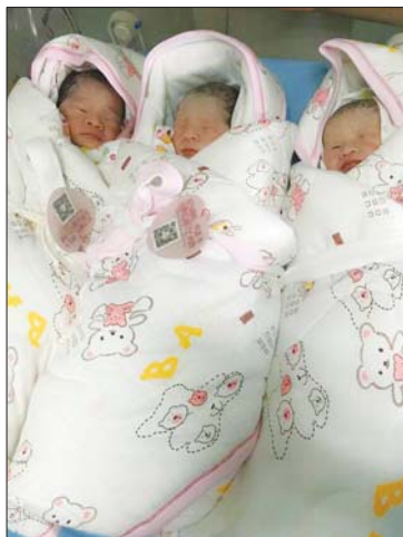
编辑:钟建军 美编:夏坤 校对:周宣刚

考虑到提女士的情况,在为其手术之前,烟台山医院产科的医护人员做好了充足准备。此外,烟台山医院产科的医护人员还提前使用了收缩子宫的药物,防止产妇产后大出血。最终,提女士分娩过程较为顺利,三个小宝宝的身体状况相对较好,目前正在儿科病房进行进一步的观察。