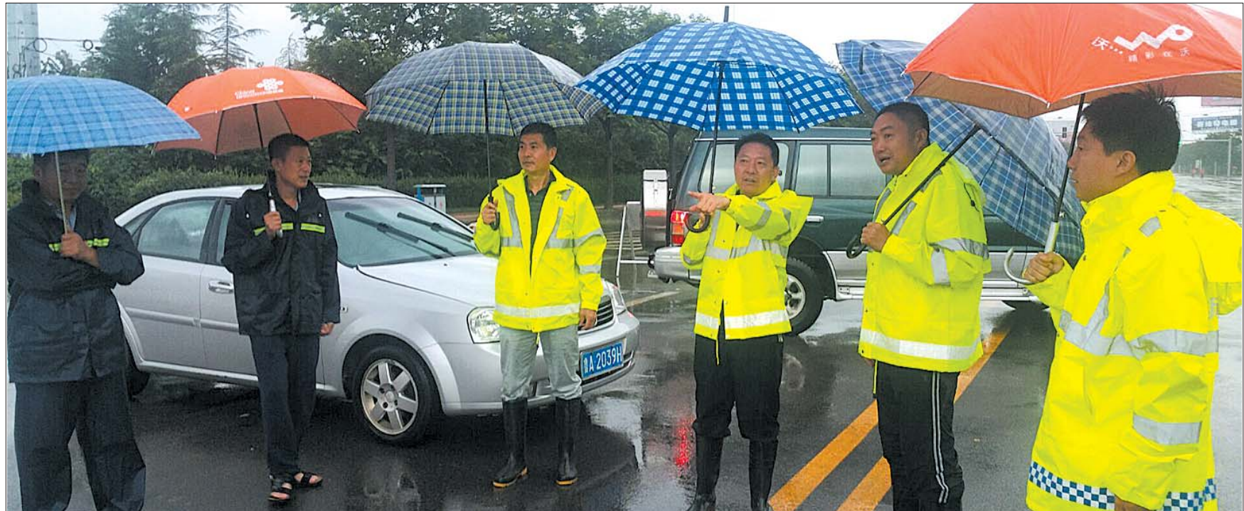
防汛人员夜班值守结束，早晨第一时间到现场查看雨情。