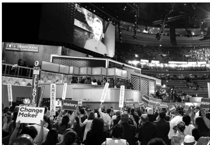
26日,在美国宾夕法尼亚州费城,身在纽约的希拉里通过卫星直播在民主党全国代表大会上讲话。

就在希拉里正式成为美国民主党总统候选人的这一天,一项最新民意调查结果显示,她的对手唐纳德·特朗普领先了两个百分点。路透社与益普索集团26日发布的联合民调显示,共和党候选人特朗普的民意支持率为39%,希拉里为37%。这是自今年5月以来,特朗普在路透社与益普索民调中首次领先。