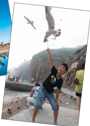
▶小记者喂食吸引海鸥。