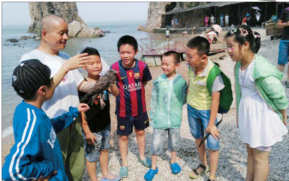
海驴岛偶遇受伤海鸥。