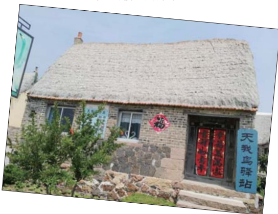
带有民俗风情的海草房。