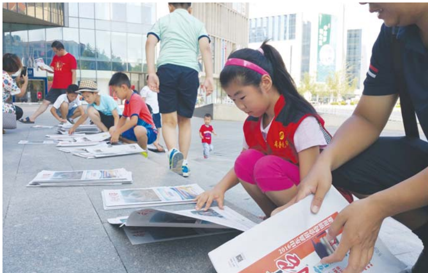
小记者们在体验卖报纸献一份爱心。

“让孩子出来义卖一下报纸,除了献爱心,还可以让孩子亲自感受一下劳动的不易,让孩子学习如何跟别人交流。”当小记者们在商场外向路人推销报纸时,在远处观望着的家长们也十分感慨。“只要孩子迈出第一步了,就没那么紧张了。”不到一上午的时间,小记者们就将报纸卖完了,虽然挣得钱不多,但孩子们都满是成就感。