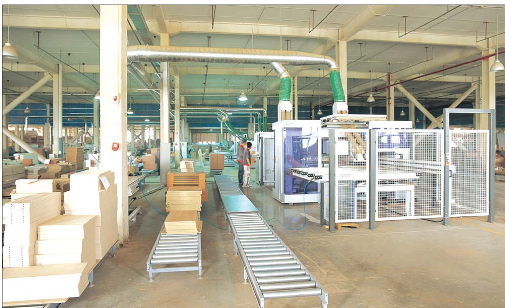
▲百强家具的北京工厂实景

目前,济南的家具行业普遍实行代理制,这种经营方式对济南家具行业的快速发展起到了一定作用。然而,随着竞争的加剧,许多家具厂家意识到代理制和激烈竞争的市场环境不相适应,代理制直接抬高了家具的