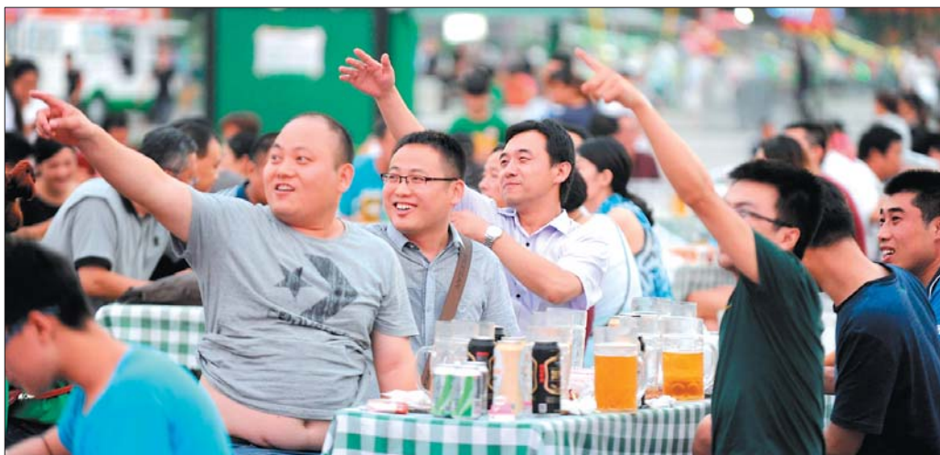
火爆的演出点燃了大家的激情。

在酒王争霸赛的现场，很多选手第一次参加比赛，没有经验，不少选手的成绩都因为剩酒、洒酒过多被判无效。之后上场的选手吸取了上一轮的教训，各路好手的比拼碰撞出激情的火花，迅速引爆全场，欢呼喝彩伴着动感的音乐律动，全场的气氛逐渐攀升到顶点。