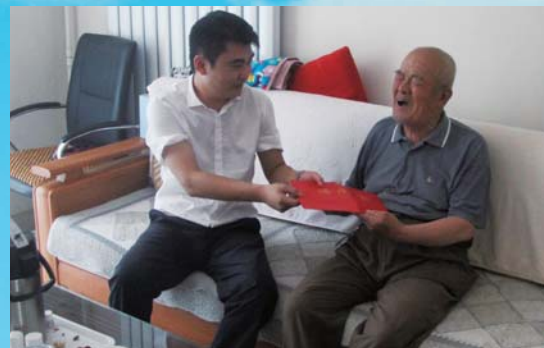
“吃水不忘挖井人”七一走访慰问老党员、老职工。

通”、“速贷通”和“车居贷”等信贷新产品,大力扶持农村社区建设,派出70多名信贷员逐村进行调查摸底,对有意到乡镇驻地和集市社区贷款购买楼房的农民,从快给予授信和办理贷款手续。近两年来,已累计发放农民住房贷款1.5亿多元,有6000多户农民在平原农商银行贷款扶持下住进楼房。同时,着力开办扶贫贷款。积极对接县扶贫办,开通扶贫“绿色通道”,截至6月末,累计发放扶贫贷款1495万元。