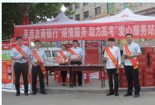
“倾情服务,助力高考”大型高考公益活动。