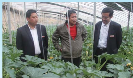
“面向三农不改志”让农民感受贴心的扶持。