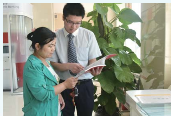
周到服务赢得客户信任。