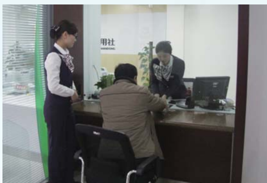
平原农商银行为客户办理业务。