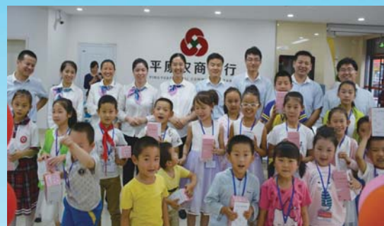
六一儿童节“小小银行家”活动。

市场冷落,企业就会停产或倒闭。针对这一情况,平原农商银行贷款帮助企业搞好新产品的研制开发,扶持企业由单一产品向多种产品转变。二是产品由低附加值向高科技含量转变。2015年以来,平原农商银行共发放贷款5000多万元,帮助13家小微企业引进科学技术,研发高科技产品38个。三是由占领国内市场向占领国际市场转变。到目前,全县已有7家小微企业的20多个产品打入国际市场。