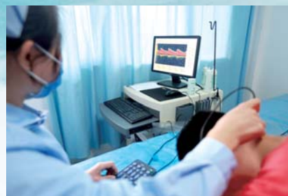
▲同德体检中心彩色经颅多普勒检测