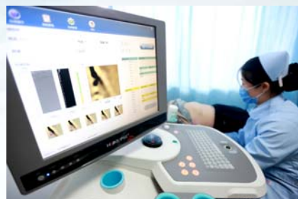
▲同德体检中心超声肝健康检测