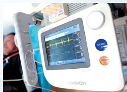
▲同德体检中心动脉硬化检测