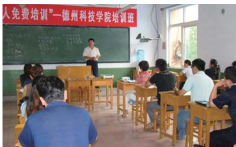
学院面向社会举办“万人免费培训”。

自2015年起,学院已连续举办两届“职业教育活动周”,通过开放校园、为民服务等方式,进一步向社会展示了学院高等职业教育的办学特色、优势,也增强了服务社会的吸引力。目前,学院2座4500平方米的实训基地已投入使用,正在科学规划、部署德州市综合公共实训中心禹城分中心的培训计划,整合先进的实验、实训设施,将面向周边县市开展全年、多样的实训培训任务,更好服务城乡百姓,为全市经济和社会发展作出不懈努力! (马东)