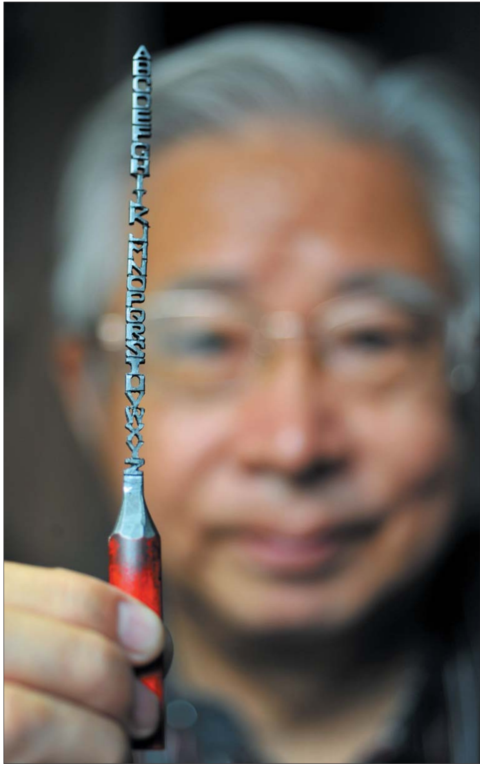
▲为了完成在笔芯上雕刻26个英文字母,他刻废了近百支铅笔。