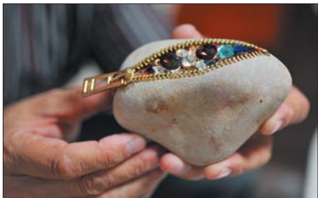
▲偶发奇想的石头钱包。