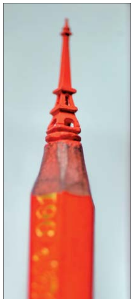
▲铅笔尖上的埃菲尔铁塔。