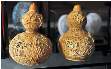
▲刻满了不同字体的“福”“寿”葫芦。