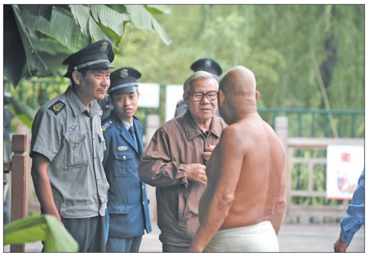
爱泉人和管理人员一起劝阻游泳者。