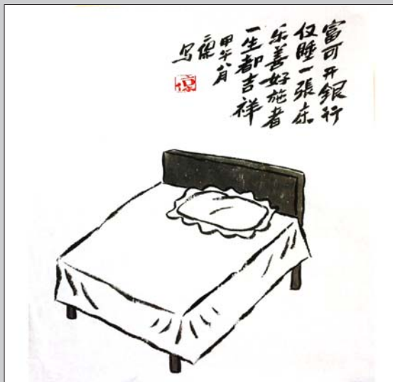
富可开银行 仅睡一张床 乐善好施者 一生都吉祥