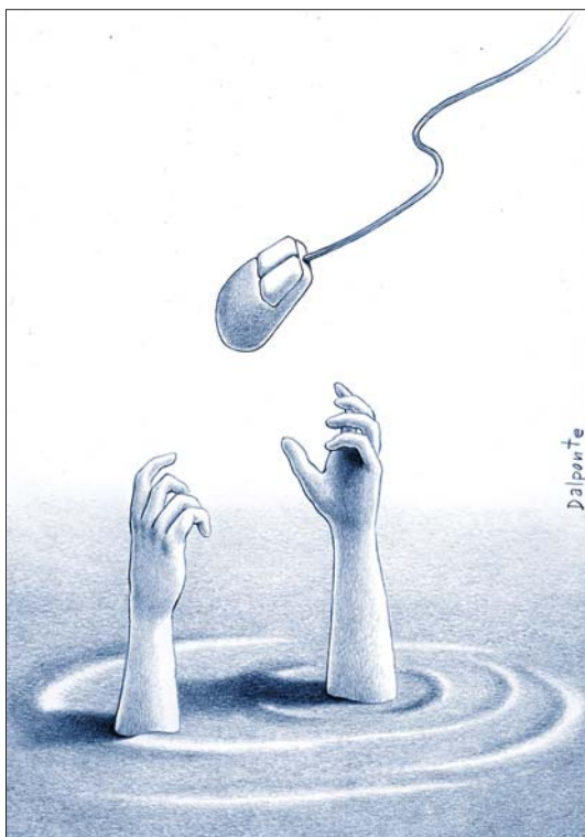
救命稻草 德尔庞 (意大利)