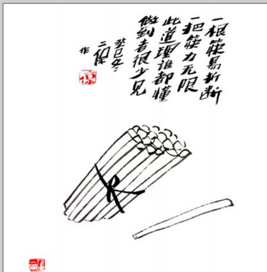
一根筷易折断 一把筷力无限 此道理谁都懂 做到者很少见