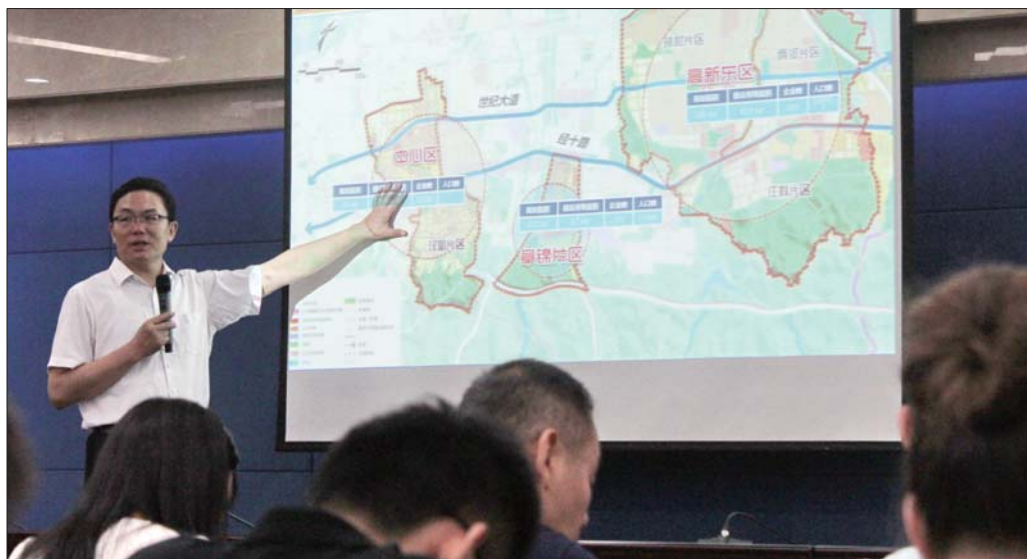
徐群为新人入职人员讲解高新区发展战略。

为了让这些新人尽快熟悉并投入济南高新区的建设中,济南高新区党工委副书记、管委会主任徐群为大家上了第一课,科普了济南的发展历史,并为大家讲解高新区的发展战略。为增加大家对高新区的直