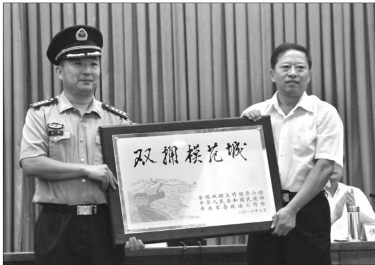
济宁市第七次荣获“全国双拥模范城”。

双拥模范城命名表彰大会相继召开,济宁市再次被命名为“全国双拥模范城”,其中9个县市全部进入全省双拥模范县行列,圆满实现了市委、市政府和军分区提出的“七连冠”“满堂红”目标,为济宁市“五城同创”又添了一张金字招牌。