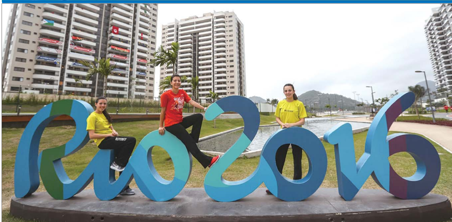
参加奥运会的运动员在奥运村留影,一天后里约奥运会就要开幕。

里约奥运会专题报道 齐鲁晚报 A23-24 2016年8月5日 星期五 编辑:尹成君 美编:马晓迪 组版:陈华