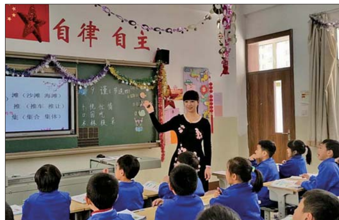
诵读识字成了学生们学习的乐趣。

的确，在育秀小学，2014级学生首次推行《诵读识字》教材，13个班的学生中有几个家长表示不理解。可经过一学期的学习，孩子识字进步的效果让家长们坦言“这本教材太好了”。据了解，《诵读识字》第一