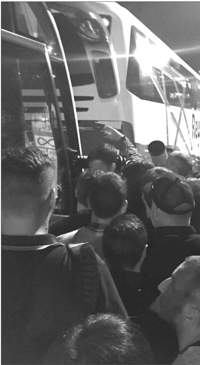
奥运开幕式结束后，各国媒体记者在马拉卡纳体育场外抢着上大巴。