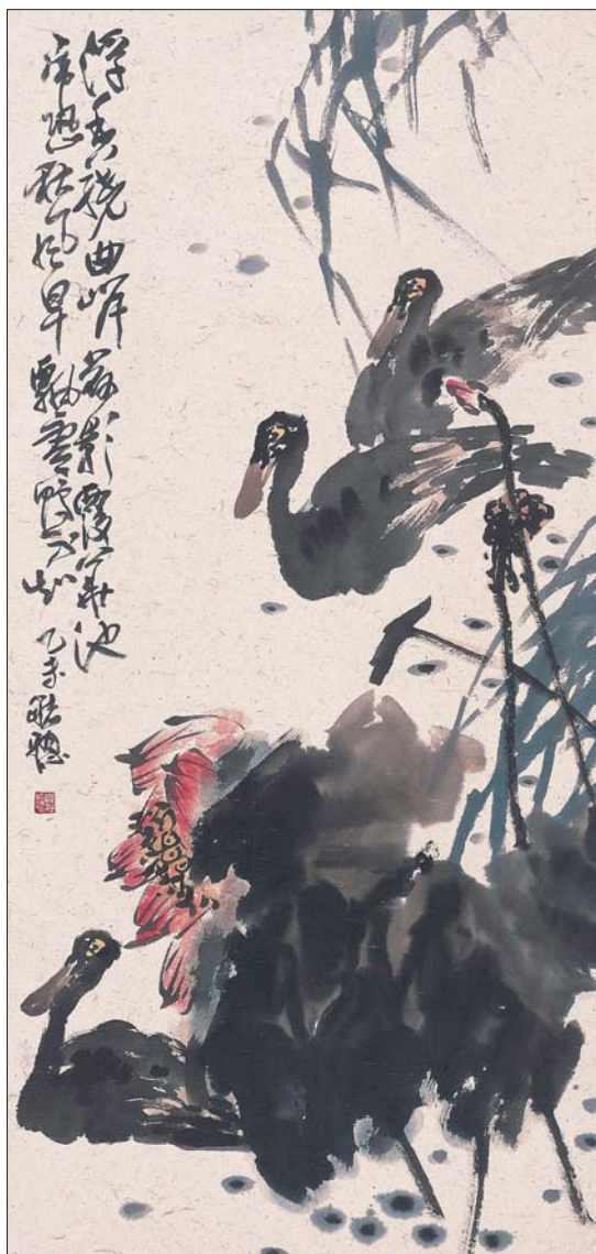
▲浮香绕曲岸 136x68cm 庄毓聪