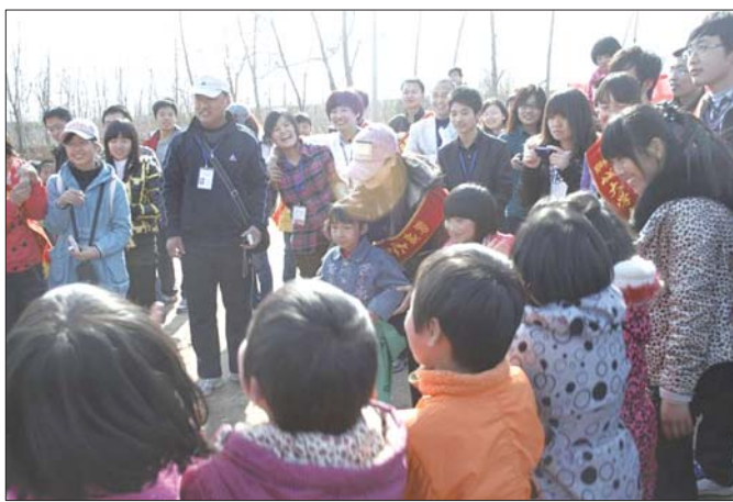
在乡村小学举办“快乐向前冲”趣味运动会。

生连续两年都获得了一等奖学金,第一年领奖时是村主任陪他来的,而第二年领奖时村里的老少爷们则都跟着来了,原来,这个孩子是单亲家庭,和妈妈在村子里相依为命,处境并不是很好,而村民们看到孩子两年都得到奖学金后,对孤儿寡母另眼相看,心生敬佩之情,“我们就是要把这样的举动变成全社会传递的正能量。”