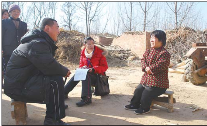
带领志愿者走访困难家庭。