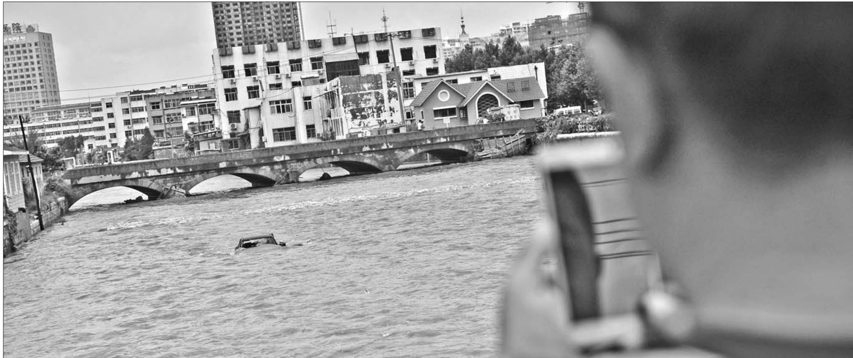
停在桥上的一辆轿车被洪水卷入河里，冲出五六百米远。