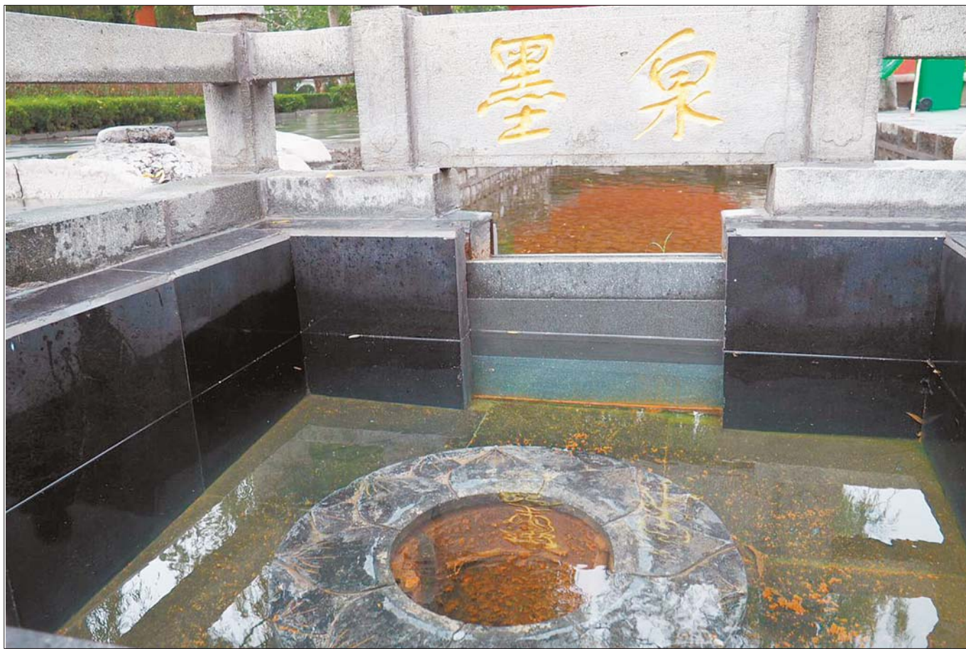
8月8日,墨泉池中有了清澈的泉水。